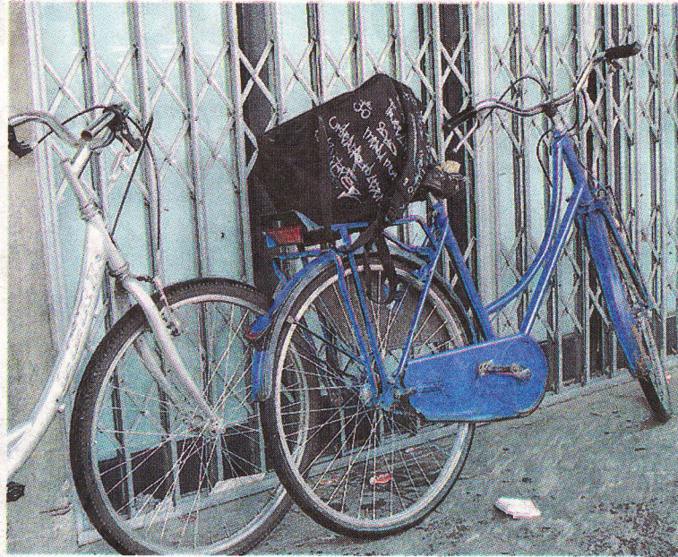
■ Biciclette in sosta. Anche la manutenzione ha la sua importanza

Rispetto al 2010 il ritorno del mercato in piazza Samek e via Cattaneo ha incrementato i transiti in